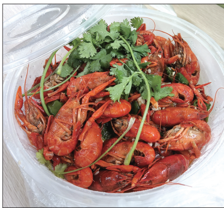
市民点的龙虾外卖。