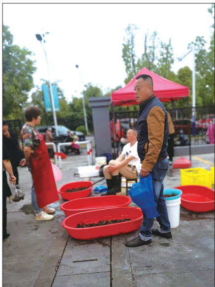
我市一处龙虾销售点。