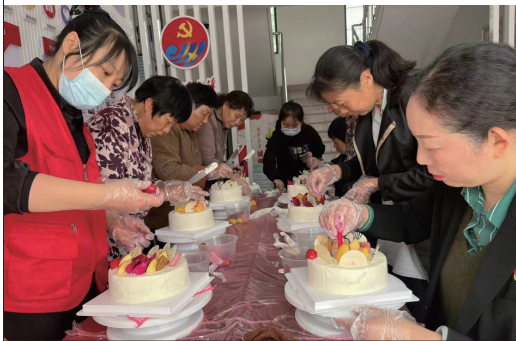
12日,陈桥街道新时代文明实践所、树北村工会联合开展“感恩母爱 幸福加‘焙’”蛋糕DIY活动,辖区女职工、特殊家庭妇女、退休女干部参加活动。 黄晶