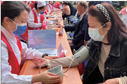
10日,虹桥街道新中社区新时代文明实践站联合南通市退休人员管理中心、南通市肿瘤医院,开展“科普促健康 携手向未来”护士节义诊活动暨在职党员志愿服务活动,为辖区居民送上医疗保健服务“套餐”。 王宋楠