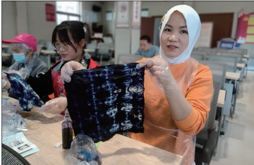
11日,文峰街道果园村社区组织辖区企业女职工、少数民族、侨胞侨眷以及失独家庭的妈妈们开展“体验非遗扎染传统文化”侨法宣传月活动,让大家现场体验传统技艺的魅力。 黄锦杰