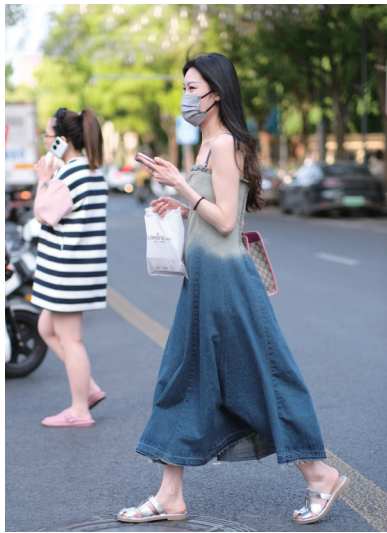
昨天,换上轻薄夏装的市民在通城街头行走。

5月17日阴有中到大雨、局部暴雨,偏东风陆上6级阵风7~8级、沿江江面6~7级阵风8级、沿岸海区7~8级阵风9级,20℃~23℃。