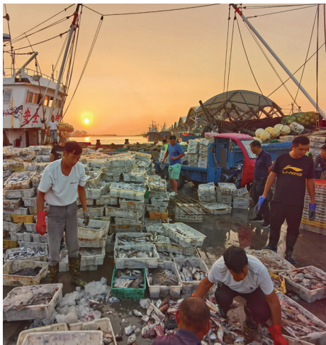
▲南通农行支持渔户远洋捕捞满载而归。