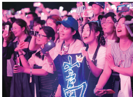
演唱会现场。