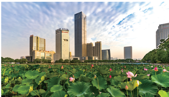
▲花海楼宇 夏日早晨,市经济技术开发区商务区,荷叶田田,荷花开放,大厦宛如在海中。 冯周鼎