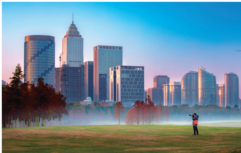
▶新城晨景 清晨,朝晖给南通新城区的建筑镀上一层明丽色彩。 陈蔚敏