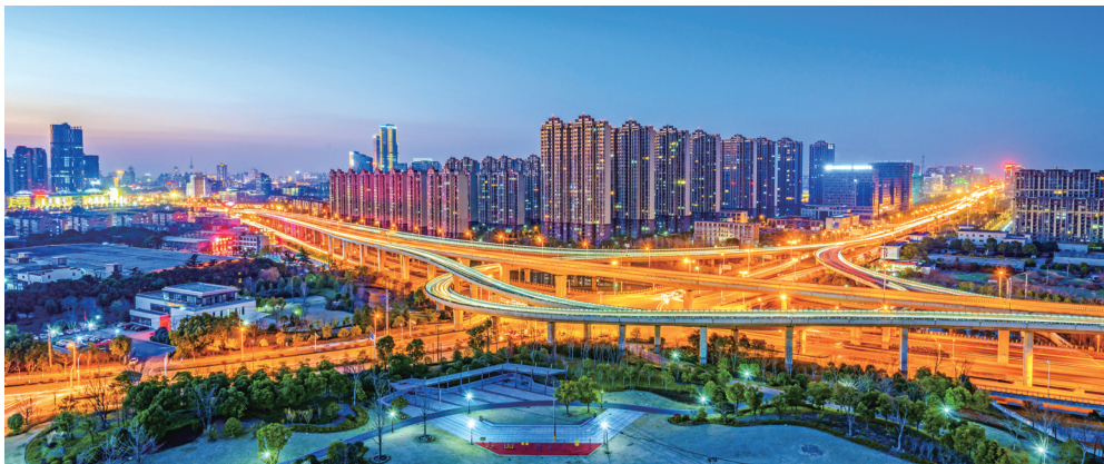
▲城市脉动 夜色中,都市高架路灯光璀璨,车流如龙,远处楼群如林。 陈鹤明