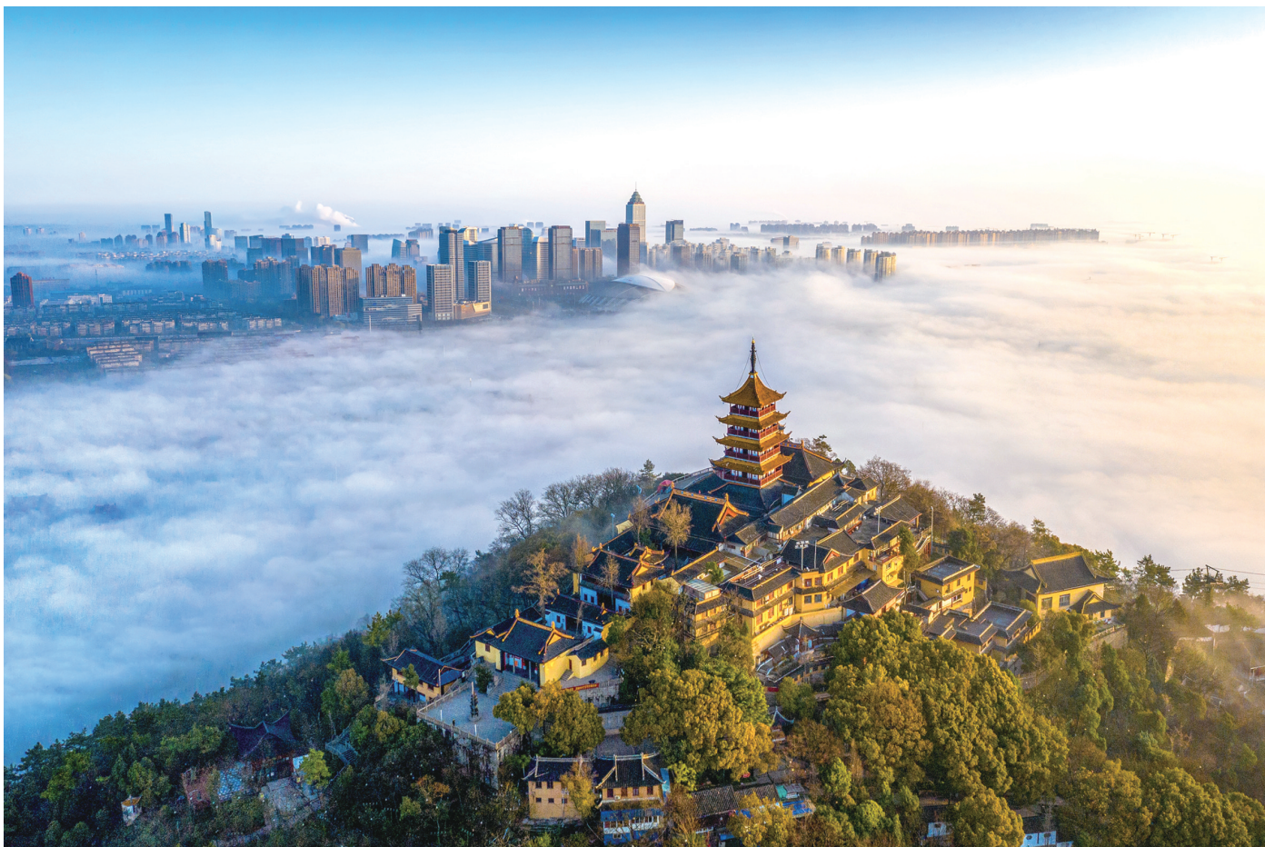
▲城山相望 朝阳初升,雾气涌动如云海,城山相望景象壮阔。 彭常青