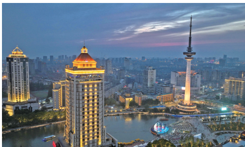
◀夏夜濠滨 薄暮初垂,濠河周边建筑次第亮起灯光,环西文化广场上游人如织。 李斌