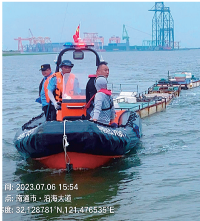
联合执法清理浮子筏。 施海华

海门区农业综合执法大队高度重视伏季休渔期间海洋渔业执法工作,结合年度“中国渔政亮剑”系列专项行动,持续对海洋渔业执法保持高压态势。为有效开展海洋渔业执法工作,海门区农业农村局联合海门区公安局、南通海警海门工作站海警、海门港新区政府,围绕市农业农村局关于印发《全市涉海船舶“三非”行为专项整治工作方案》,重点开展非法鳗鱼苗、花蛤捕捞以及“三无船舶”和涉渔浮子筏的专项执法行动,有力地打击了非法捕捞者的嚣张气焰,