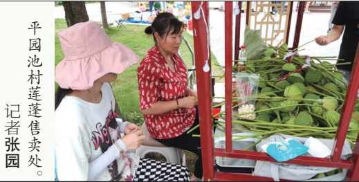
平园池村莲蓬售卖处。

眼下正是赏荷的最佳时节,这两天,市区怡园、西公园等处的荷塘,依旧是广大市民的网红打卡地。不光是荷塘秀色引人陶醉,这些年,我市的荷花产业也是蓬勃发展。