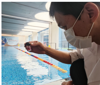
卫生监督人员在我市一小区游泳池测量水质。

炎炎夏日,泳池是消暑降温的绝佳去处。曾几何时,不少小区在建设过程中就配套了游泳池。但是,这些家门口的泳池也存在一系列问题:交付前所承诺的“恒温功能性泳池”变成了交付后的“景观戏水池”,交付前承诺开放使用而交付后便关停了,在用的泳池水质安全无法保证,甚至还有的经营泳池的商家一夜跑路……这些问题确实让广大业主头疼。