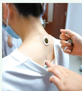
医生为患者做三伏贴治疗。