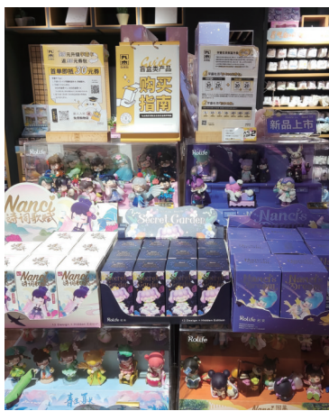
我市一家商店售卖的盲盒。

市场监管总局上月中旬发布的《盲盒经营行为规范指引(试行)》,不仅划出盲盒经营领域等,还明确要求盲盒经营者对销售对象的年龄作严格限制。那么,盲盒新规试行一个多月来,我市实际状况如何?昨天,本报记者对此进行了走访。