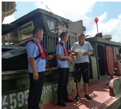
执法队员上船宣传。