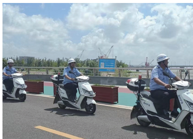
护渔员陆上巡查。