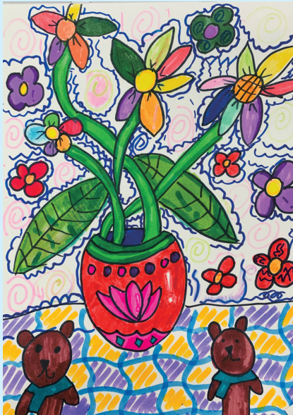
春 紫琅湖实验小学二(3)班 俞佳彤