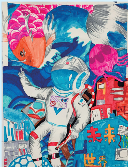
未来世界 紫琅湖实验小学二(3)班 谢佳熙