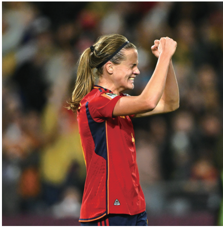
20日,妈妈球员伊雷妮·帕雷德斯庆祝夺冠。