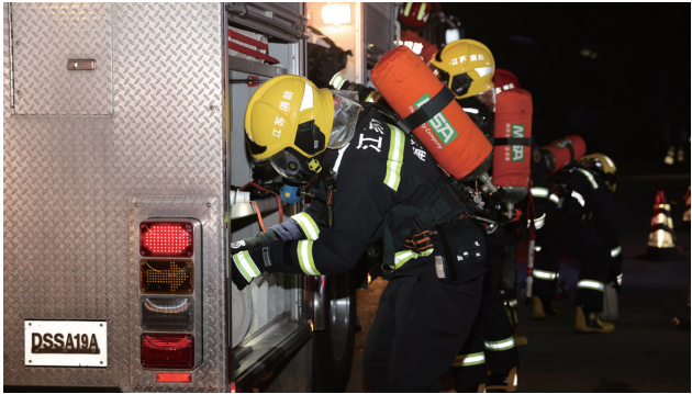
消防部门开展商业综合体“六熟悉”演练。童晓轩