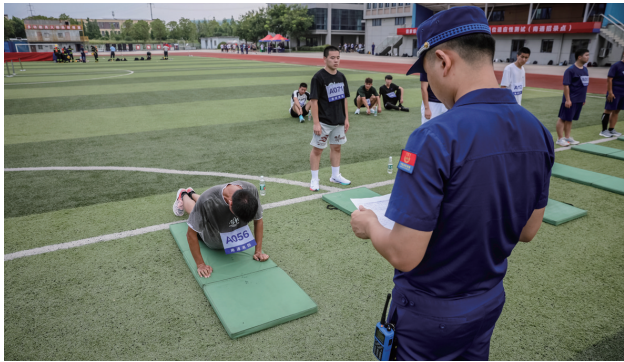
市消防救援支队开展新招录消防员岗位适应性测试。 马晶晶

目前,全市已完成安装人工智能识别“阻车”系统19887套,建成电动自行车充电设施和充电点9100处,并分步推行将居民小区集中充电区电瓶车火灾事故纳入自然灾害民生保险项目范畴。支队还将逐步加大宣传推广力度,积极预防电动自行车入楼入户充电行为,切实以科技化手段高效筑牢火灾防线。