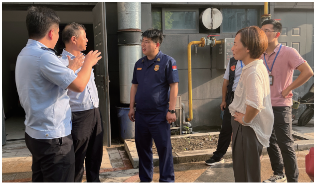
海门消防开展夏日消防安全大检查行动。 沈海琳