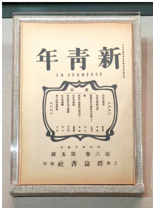
《新青年》(6卷5号)复制件

将展览打造成全市主题教育的现场教学观摩点,让全市党员干部近距离感悟习近平总书记的思想伟力,从伟大建党精神中汲取前行动能。同时,在9月8日至10月8日展期期间,博物苑还将开展相关主题社教活动,引导更多青少年走进展厅,传承红色基因,树立爱国主义情怀。 记者杨镇潇