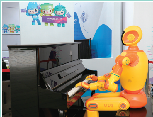
钢琴机器人在杭州亚运村内弹奏乐曲。