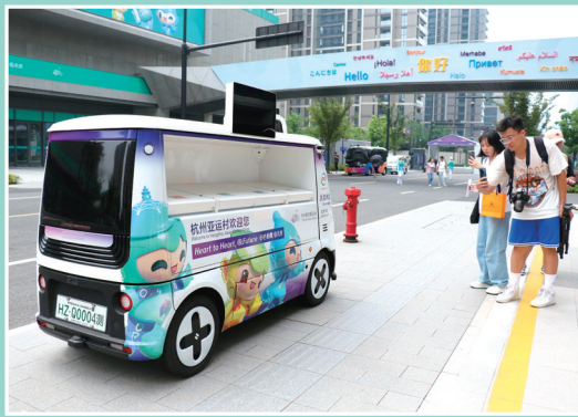
无人冰淇淋车在杭州亚运村中提供服务。