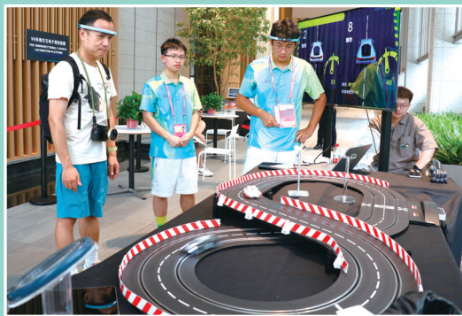
杭州亚运村中的脑机赛车,可以通过脑电波控制、用“意念”让赛车跑起来。