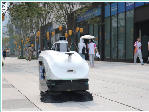
智能扫地机器人在杭州亚运村中工作。