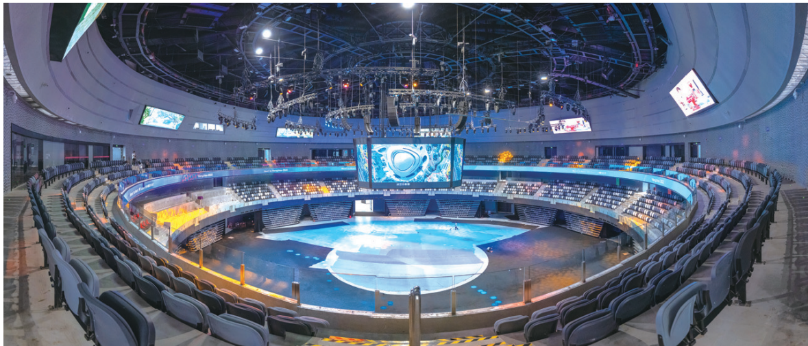
杭州亚运会电子竞技项目场馆科技感十足。