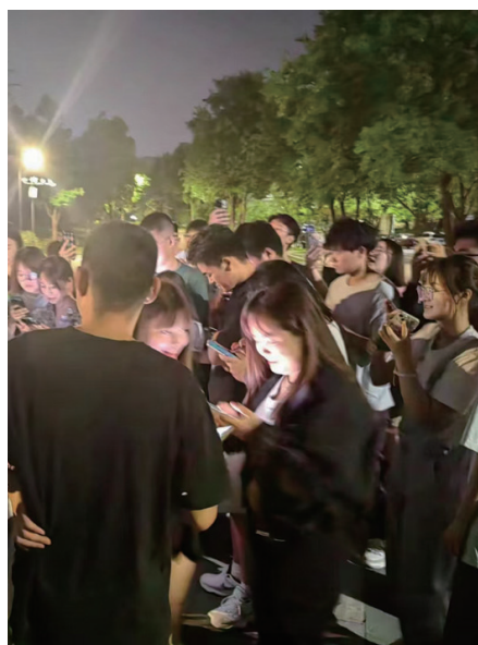
活动参与者在出发点集合。