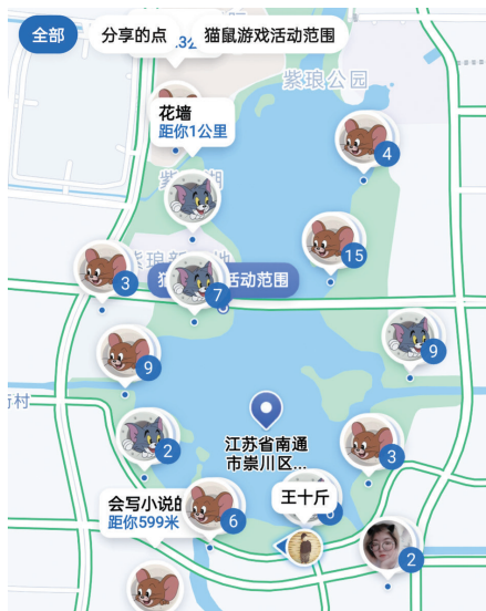
活动中使用的导航App界面截图。