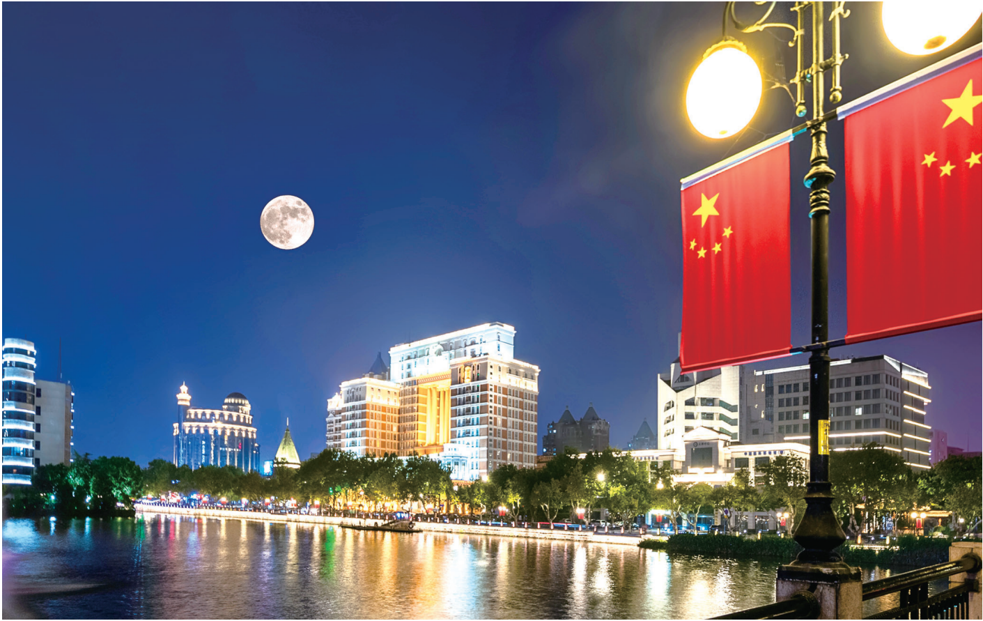
▲濠滨月色 昨晚,市区濠河边文化宫桥上拍摄的中秋圆月。