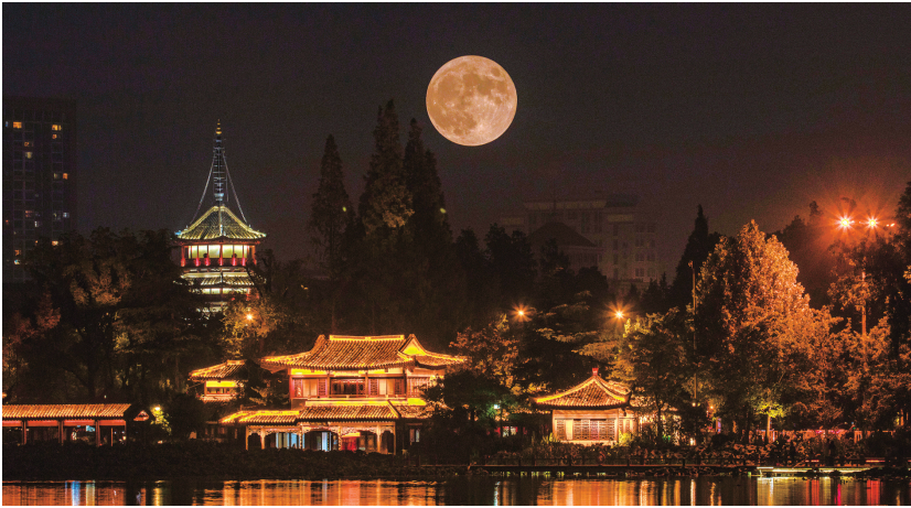
▲启秀之月 昨晚,从南通大学启秀校区望向启秀园,一轮中秋明月从东方升起,普照大地,为千家万户的团圆添彩增色(二次曝光)。钱伟章