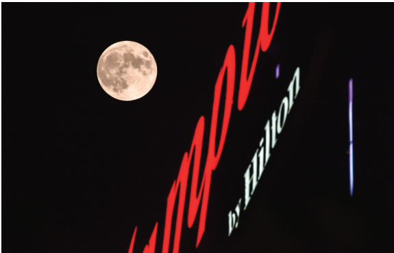
▲月亮升起 昨晚,一轮圆月从江海大道旁一家酒店的店招霓虹旁升起。陈德军