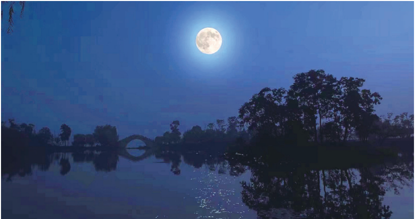
▲紫琅湖上 中秋夜,一轮圆月升起在市区紫琅湖上空,在湖面洒下清辉一片(二次曝光)。黄红军