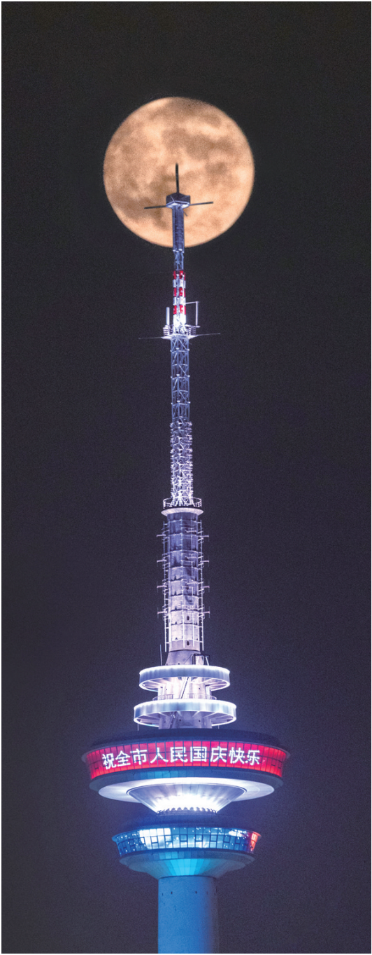
▲塔顶合月 中秋夜,一轮圆月升起,与南通电视塔合影(二次曝光)。孔玮