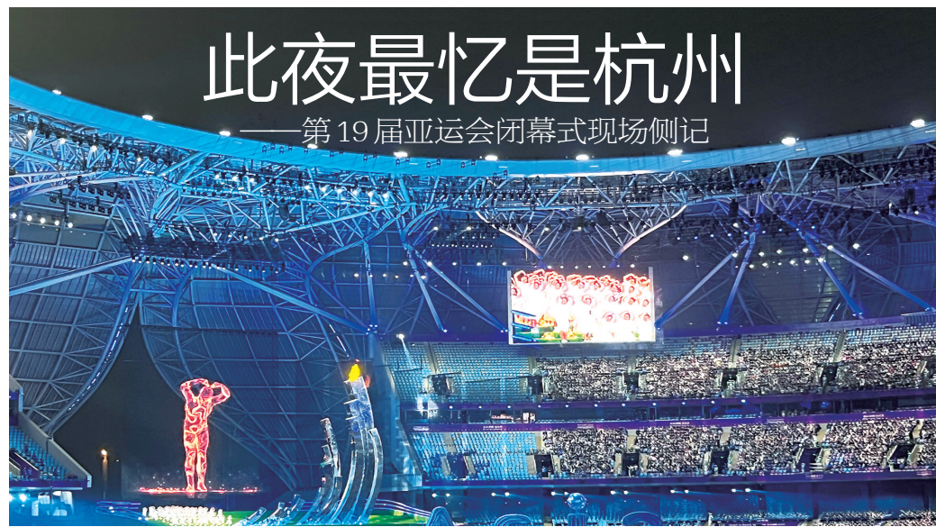
闭幕式上“弄潮儿”比爱心。 记者张坚

心心相融,@未来。叫响杭州亚运的口号,离不开高科技的加持。开幕式使用了实现裸眼3D视效的超大地屏,闭幕式则首创亚运史上第一个“数控草坪”。看似很平常的草坪里面藏着玄机,近4万个发光点结合AR等技术变换多种图案、文字、颜色等,产生独特