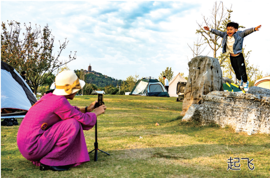
11月5日,狼山风景区,秋游的祖孙俩沉浸在拍摄视频的快乐之中。