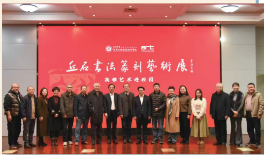
2023年11月13日丘石个展参展嘉宾合影。