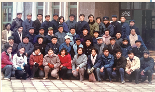
1985年12月20日丘石个展参展嘉宾合影。