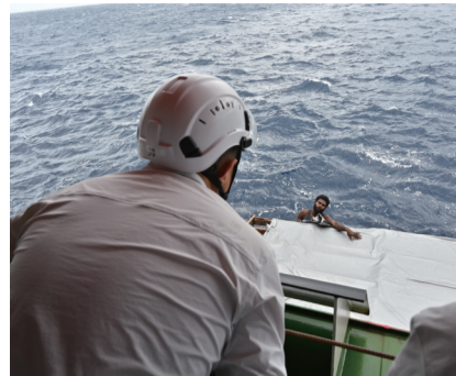
11月10日,“雪龙2”号考察队队员和求救人员沟通。