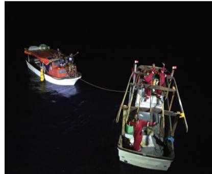
11月11日傍晚,考察队将求救船只和人员移交当地接应船只。