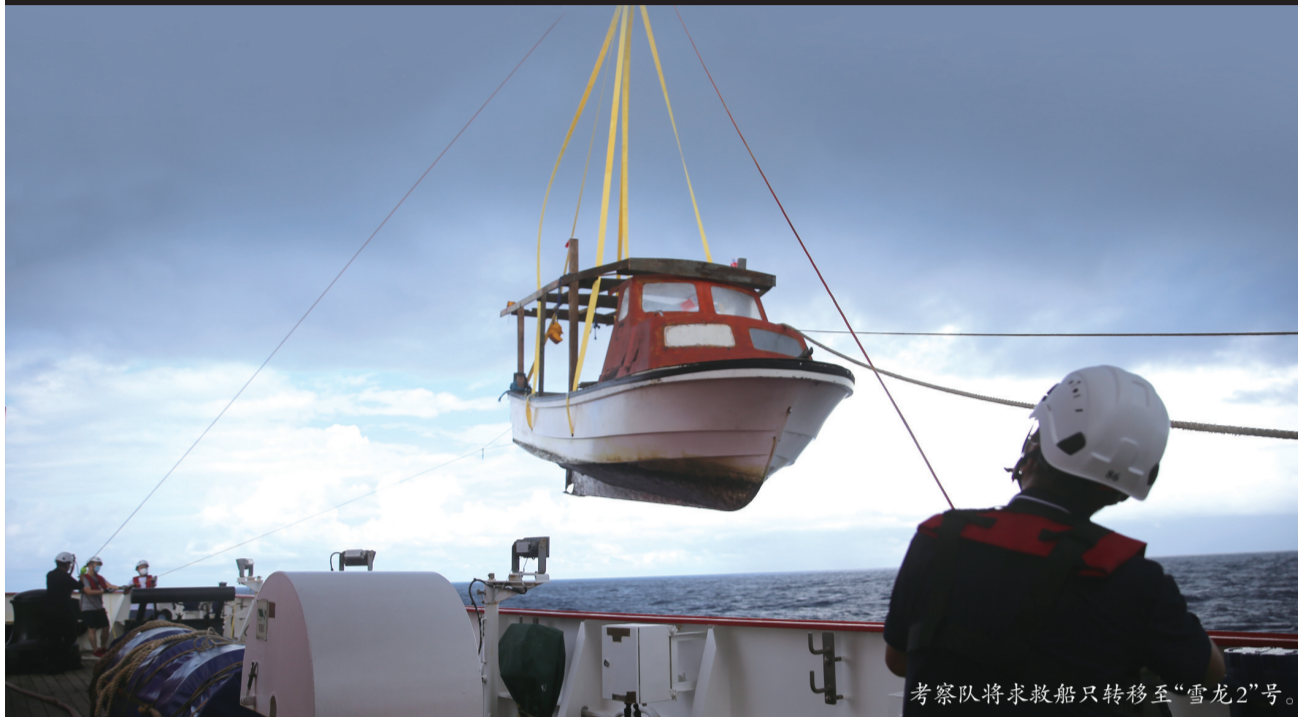
考察队将求救船只转移至“雪龙2”号。