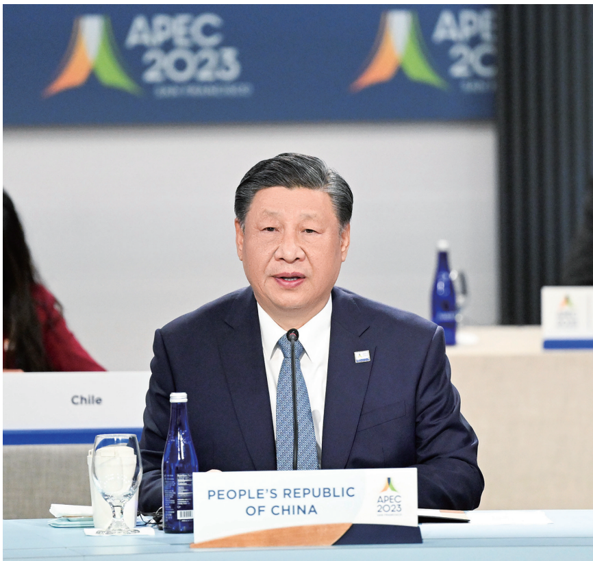
习近平出席亚太经合组织第三十次领导人非正式会议并发表重要讲话。

第一,坚持创新驱动。要更加积极地推动科技交流合作,携手打造开放、公平、公正、非歧视的科技发展环境。加速数字化转型,缩小数字鸿沟,支持大数据、云计算、人工智能、量子计算等新技术应用,不断塑造亚太发展新动能新优势。中国提出亚太经合