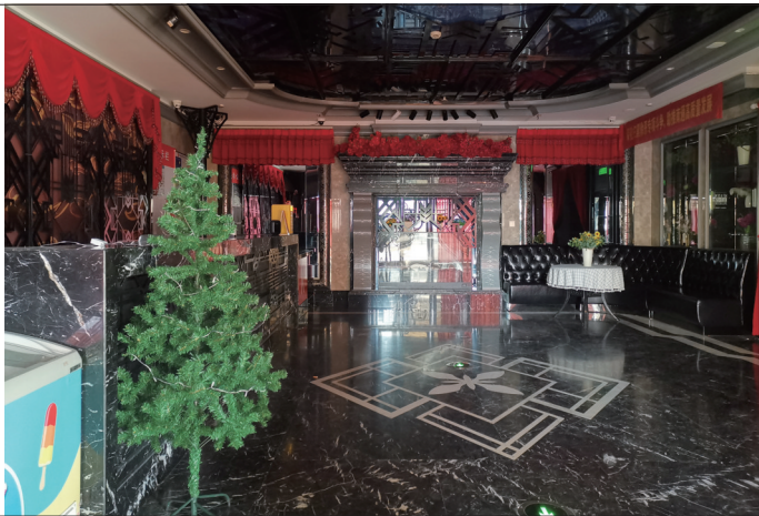
去KTV唱歌的人少了。 记者周朝晖

对于KTV,不少人记忆中还留存着亲切而温馨的味道,那是与自己过生日、和情侣约会等有关的见证,也是朋友聚会等曾密切相关的一种社交娱乐方式。可不经意间,“KTV衰退趋势肉眼可见”成为人们热议话题。昨天,本报记者采访市民、店家和专家,了解人们不爱去KTV的深层次原因。