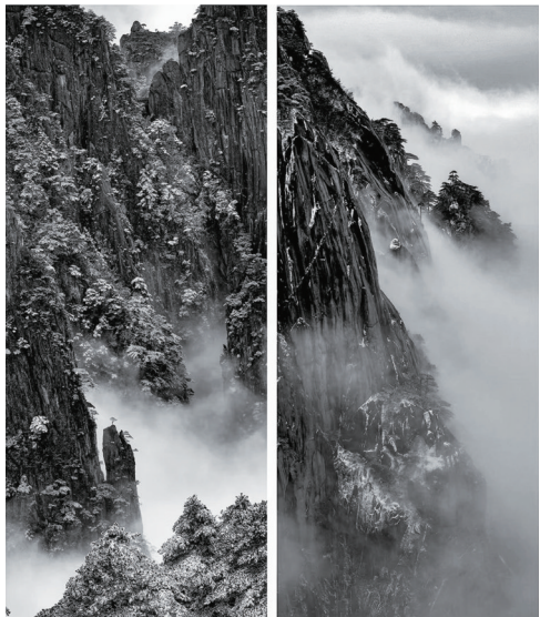
艺术类组照《云雾缭绕》一组 严荣华