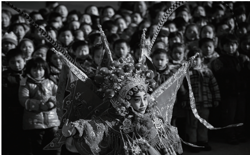
纪录类组照《薪火相传》之一 黄哲