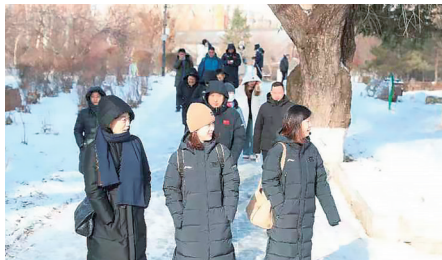
长春德苑吸引了众多外地朋友前来打卡。