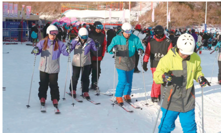
天定山滑雪场用微笑传递真情。