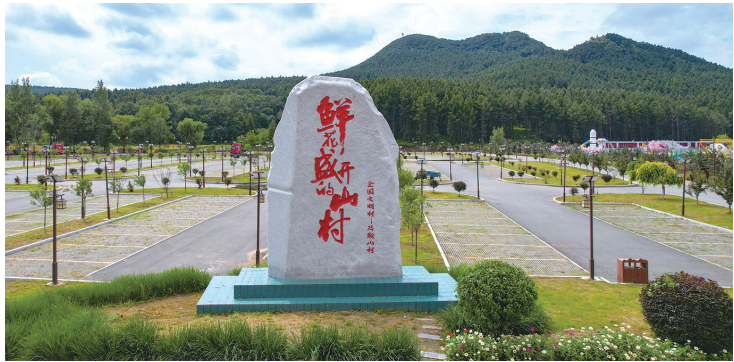
马鞍山村,电视剧《鲜花盛开的山村》曾在此拍摄。