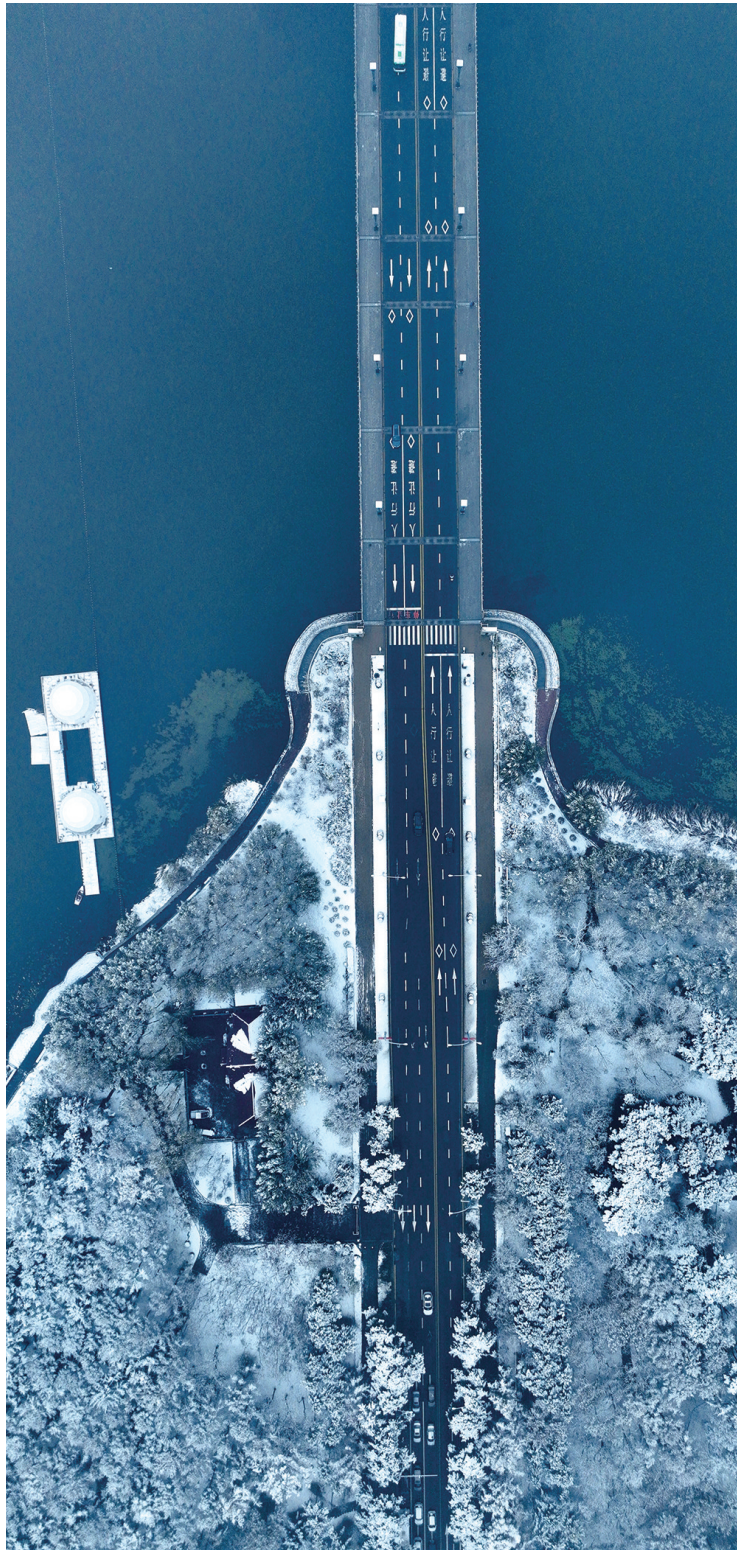
俯瞰冬季长春的南湖大桥。

当人们还在感叹长春的深秋美得犹如一幅五彩斑斓的油画之时,一夜之间,洋洋洒洒的初雪又把长春染成了一幅水墨画,简直就是大自然版的“白富美”。