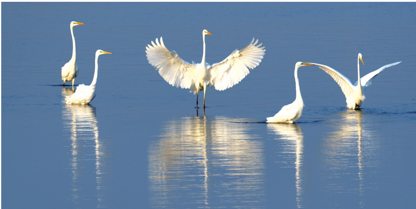
▲起舞 11月27日,通州湾,一只大白鹭翩然起舞,姿态优美。吴为民