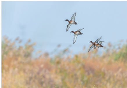
▲扑翅 十一月二十六日,如皋长青沙,一群青头潜鸭从芦苇深处扑翅飞起。陆信