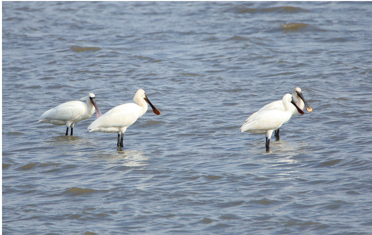
▲倩影 11月5日,通州湾,几只黑脸琵鹭和白琵鹭的倩影出现在滩涂上。陈欣欣