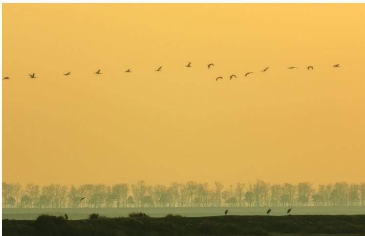
▲乐园 11月27日,启东江边,一行鸟儿掠过防护林带上空。黄是春