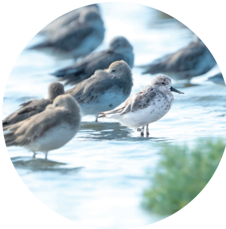
▲独特 九月二日,通州湾,一只勺嘴鹬姿态独特,混迹在群鹬中。葛锦平