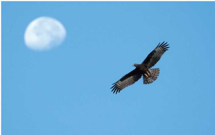
▲高飞 11月2日,军山绿野上空,一只凤头蜂鹰展翅高飞。管昊昱