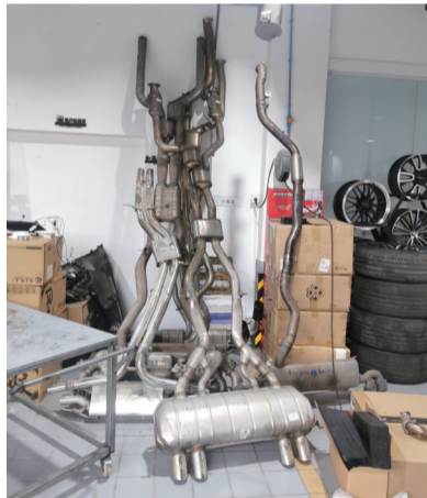
查获的改装配件。宋晓荣

9月7日,南通市交通运输执法部门联合市场监管部门,对南通某汽车服务有限公司进行溯源检查,发现其