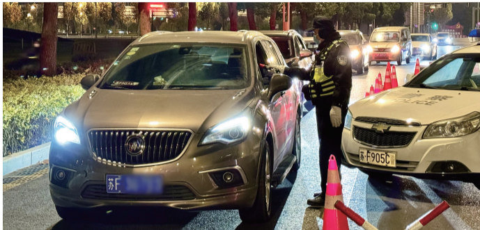
夜查现场。

晚报讯 1日,全市公安机关启动“冬季行动”集中攻势,严打严防今冬明春的高发、多发违法犯罪活动。当晚,首次集中设卡盘查“零点行动”开展,全市共出动警力1003人次、车辆180辆,查获气枪1支,抓获现行违法犯罪嫌疑人5名、逃犯1名,查处酒驾42起、醉驾21起、炸街飙车2起。