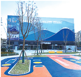
任港路南停车楼外观。

产业园,与万濠华府、都市华城、天润锦园等住宅小区相邻,项目占地面积约13.7亩,包括北侧绿化小游园和南侧停车楼。项目总建筑面积约14246平方米,地下部