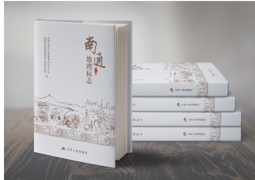
《南通地理标志》封面。

晚报讯 近日,由市地方志办公室、市市场监督管理局(知识产权局)组织编纂的《南通地理标志》一书由江苏人民出版社出版发行。该书是全省首部系统介绍地理标志的特色地情书籍,也是继《南通简志》《南通老字号》《南通传统村落》后,市地方志办近年来编纂的第四部南通历史文化系列丛书。