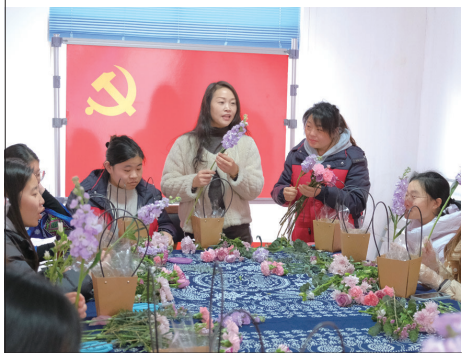
近日,陈桥街道集成村工会联合江苏商贸职业学院开展“情暖冬日 花漾年华”系列插花活动。