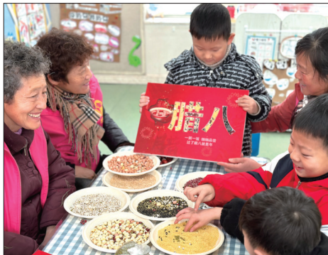
昨天,和平桥街道起凤社区妇联、工会组织党员志愿者、网格员走进跃龙桥小学幼儿园开展主题活动。