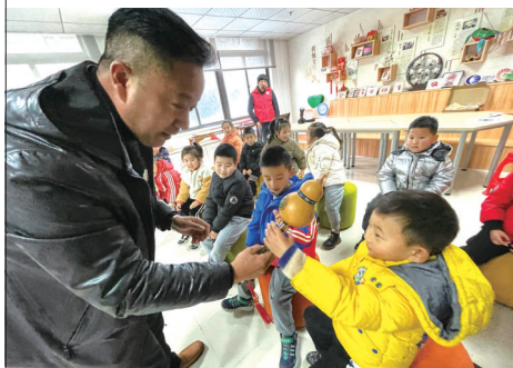
15日下午,崇川经济开发区学堂桥社区联合观阳幼儿园开展民乐培训进社区活动。