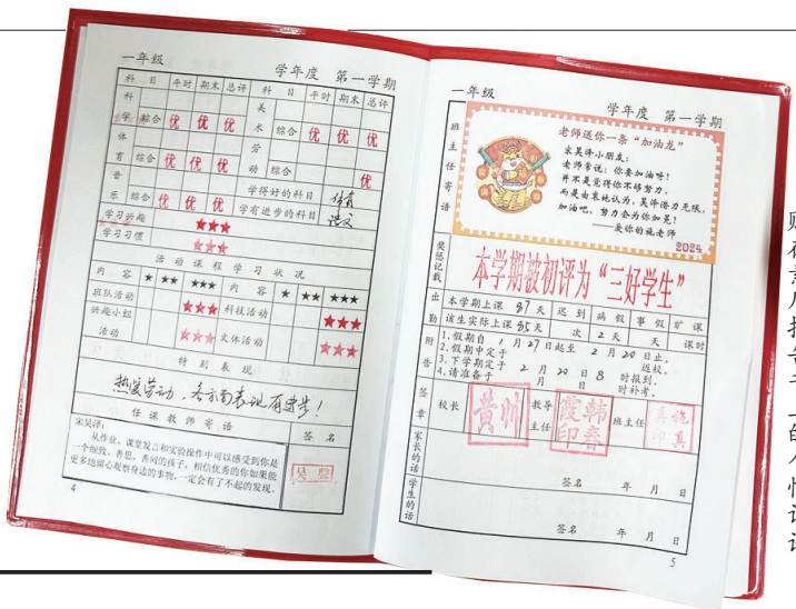
贴在素质报告书上的个性评语。

26日,我市各小学举行散学典礼,寒假正式开启。不少学生和家長在拿到素质报告书时惊喜地发现,老师们大展才华,各显神通,将创意与爱相结合,写下了各具风格的“花式”评语,给了孩子们满满的仪式感。