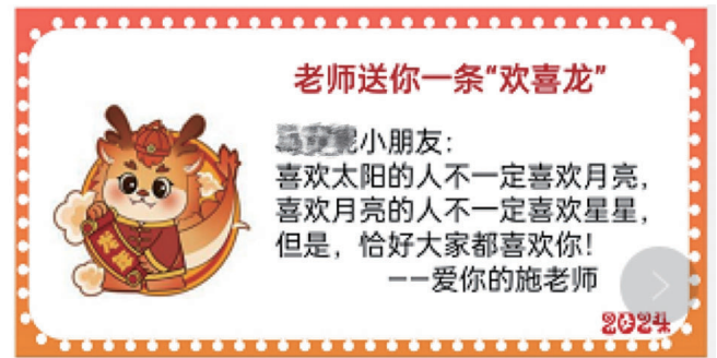
配上卡通龙形象的评语。