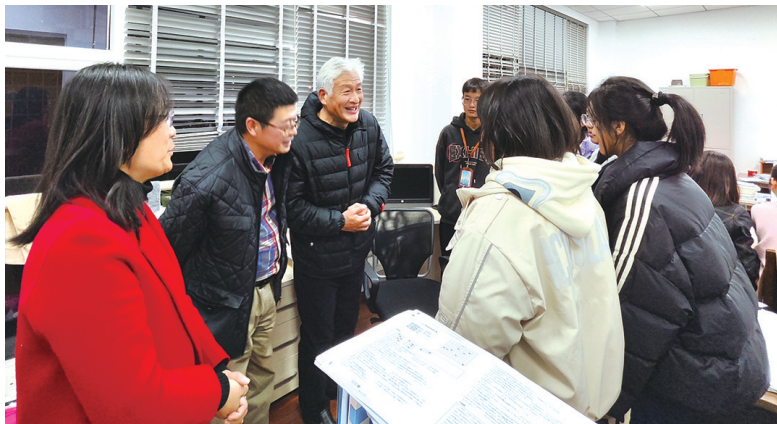
退休教师与孩子们在一起。

去年,我市启动退休教师教育援青项目,先后组织两批退休教师赴贵德支教。正是这次支教,让南通退休教师和青海少年们的“山海情”孕育而生。