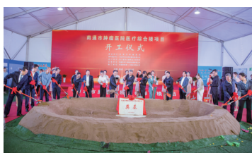
北院医疗综合楼奠基仪式