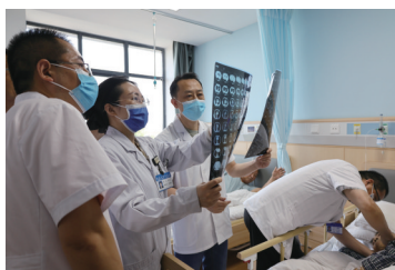
癌症防治医防融合基层行启动仪式