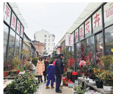
逛市场的市民络绎不绝。记者奚柯柯

宠物同样也销售火爆;在观赏鸟交易区,绿色、黄色的虎皮鹦鹉也被不少前来选购的市民品赏着,顺带着也拉动了鸟笼、鸟食等配套产品的销售。