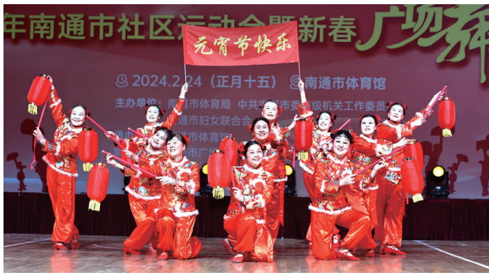
舞蹈艺术团队分别展示舞艺。