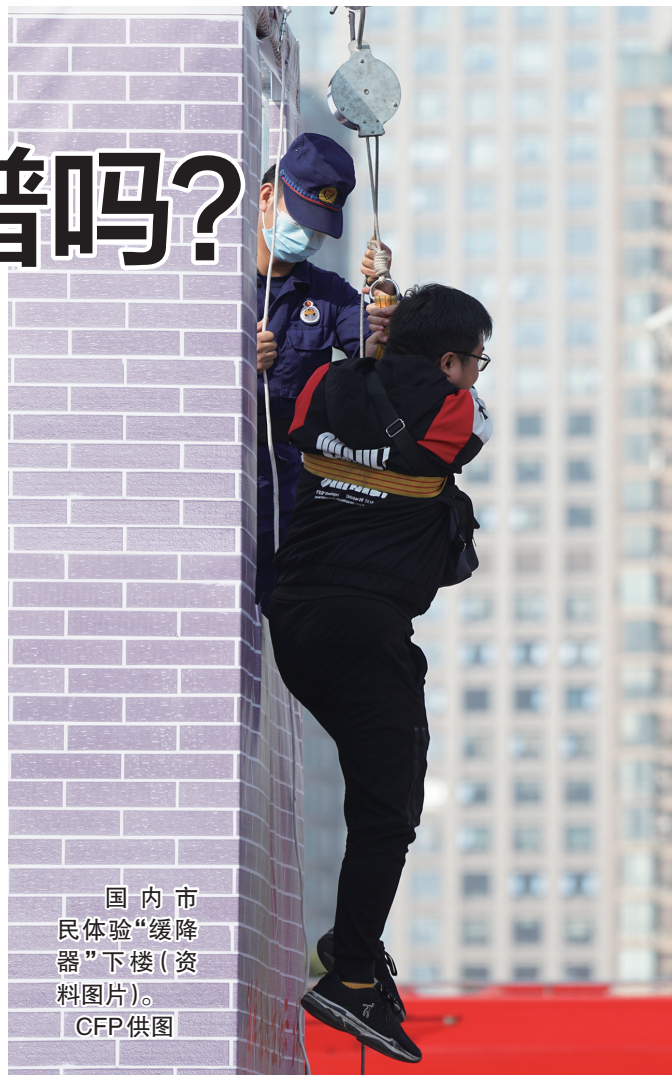
国内市民体验“缓降器”下楼(资料图片)。