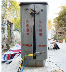
变电箱露出的电缆。

南通供电公司对市民反映的问题通过政府热线平台及时作出回复,介绍目前供电公司已安排工作人员对电缆故障点进行探测,待故障点找到后,将会立即修复故障点、恢复原