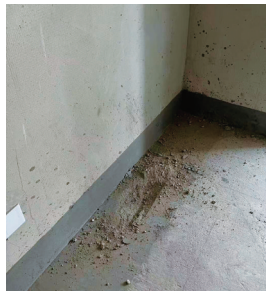
酥松的房间地面。 记者奚柯柯

了解实情后,记者采访了“金雅·恒水鑫城”项目负责人冒建。他解释,业主们反映的地面酥松现象,系4厘米左右的找平层在施工后期养护不到位所致,确有质量问题。负