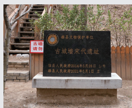
这是位于雄安新区雄县的雄州古城遗址残留城墙(3月27日摄)。