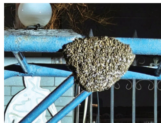
▲健身器材上的马蜂窝。 ▲消防员处置马蜂窝。

晚报讯 随着气温升高,蜂类逐渐活跃了起来。近期,南通消防处理了多起蜂类扰民事件,消防救援人员第一时间开展“灭蜂行动”。