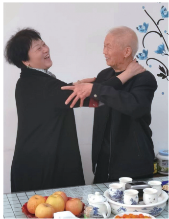
樊玉如见到救命恩人。