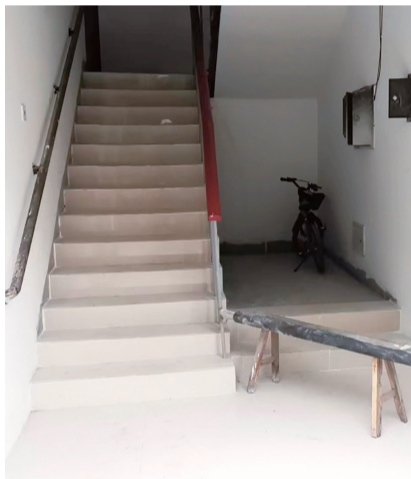
修复好的楼道。