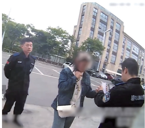
一秒前,安抚当事人情绪。