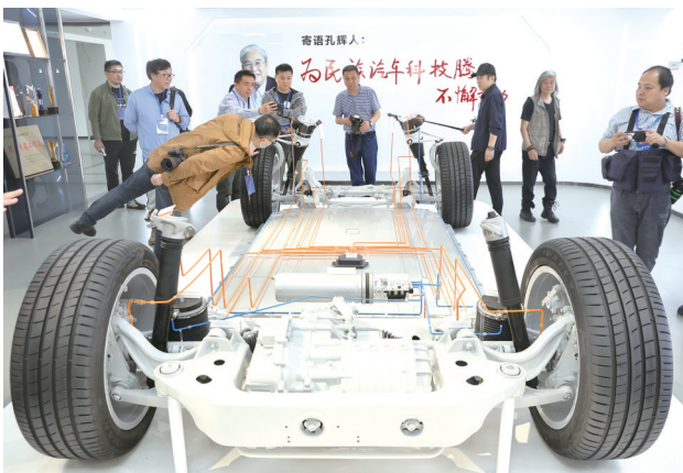
▲国内首个乘用车 电控悬架系统新样品。