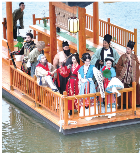
长田漾湿地公园古装游船。