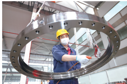
精工产业园企业生产忙。