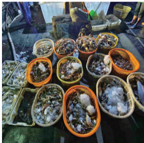
◀非法捕捞浮子筏。 ▲非法渔获物。

晚报讯 11日晚,南通海警局如东工作站的执法人员正在执行维护海上治安任务,在巡逻至如东阳光岛附近海域时发现一个可疑目标。执法人员迅速向该目标接近,发现是一艘正在从事捕捞作业的浮子筏。