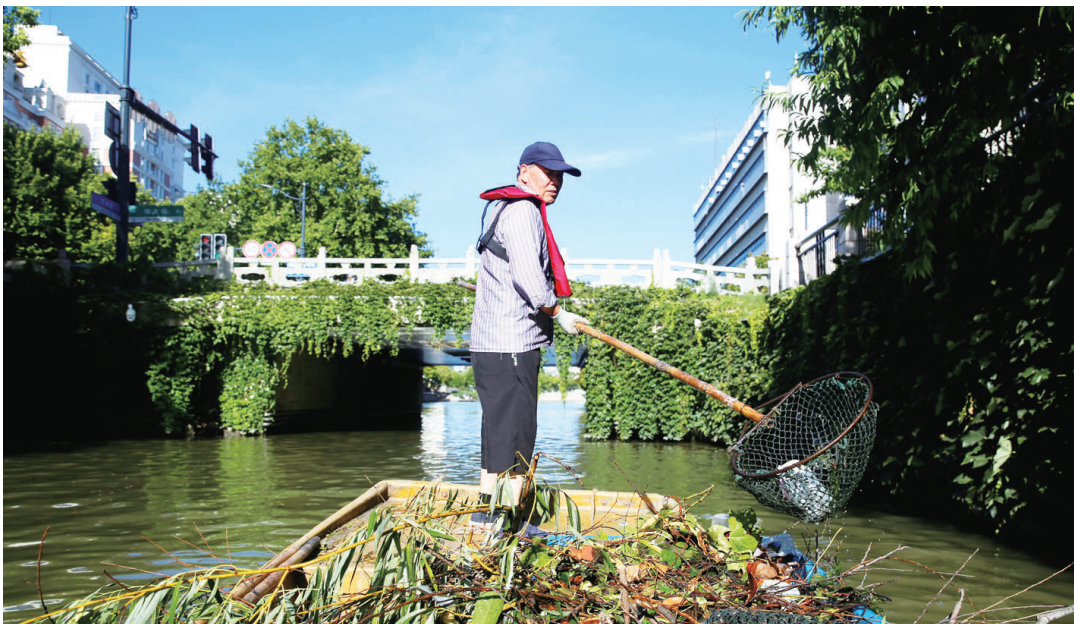
『美容师』打捞河面漂浮物。尤炼

连日来，通城持续高温，且有大风等强对流天气。为守护母亲河的清澈明净，被誉为濠河“美容师”的水面保洁工作人员任劳任怨，在平凡岗位上用汗水谱写感人篇章。