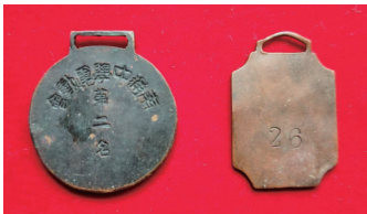
▲►3枚体育奖章的正反照。