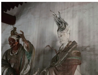
▲二十八星宿殿内的亢金龙彩塑。

挖掘文物蕴含的文化内涵，丰富讲解方式，用数字化激发文物活力，通过文创产品将文化元素凝练于方寸之间，使旅游成为感悟中华文