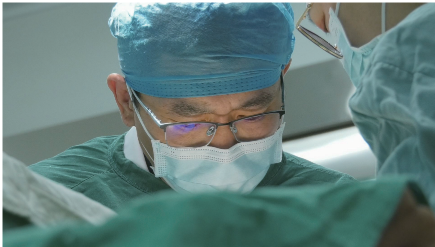
牙齿缺失的常见危害